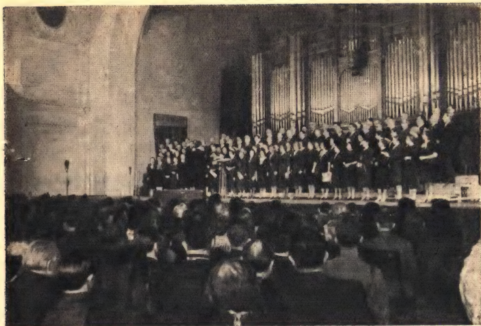
Патриарший хор на духовном концерте 6 февраля

Программа концерта состояла из трех отделений, причем первые два отделения были целиком посвящены исполнению церковных песнопений. Останавливает на себе богатство и разнообразие программы. Она обнимает песнопения и всеобщего бдения, и литургии, периода Великого поста, Страстной седмицы, Пасхальной седмицы и дает образцы церковной музыки разных времен и стилей, начиная от обиходного и кончая последними церковными композиторами. Здесь есть и старинные Бортнянский и Турчанинов, более поздние Львов и Ведель, Смоленский и Архангельский. Имеются и последние представители церковной музыки: Чайковский, Рахманинов, Чесноков, Данилин, Кастаньский.